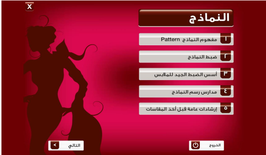
شكل رقم (٥) يوضح شاشة روابط النماذج

توجد علامة (x) في أعلا يسار الشاشة عند الضغط عليها تظهر شاشة البرنامج الرئيسية، اذا أراد المتعلم الانتقال الى رابط رئيسي آخر بالضغط عليه، فمثلا عند اختيار رابط النماذج تظهر شاشة بها الروابط الفرعية الخاصة بالموضوع شكل (٥)