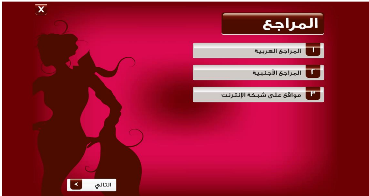
شكل رقم (٨) يوضح شاشة مراجع البرنامج

يوجد بالشاشة الرئيسية للبرنامج رابط خاص بالمراجع عند الضغط عليه يظهر لنا شاشة بها الروابط الفرعية له شكل (٨)