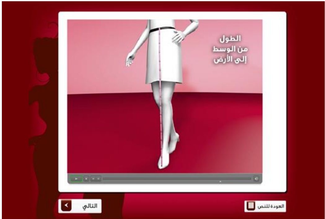
شكل رقم (٦) يوضح شاشة فيديو لطريقة أخذ المقاسات

كما تم وضع مجموعة من الفيديوهات التوضيحية بالبرنامج خاصة بطريقة أخذ المقاسات شكل (٦)