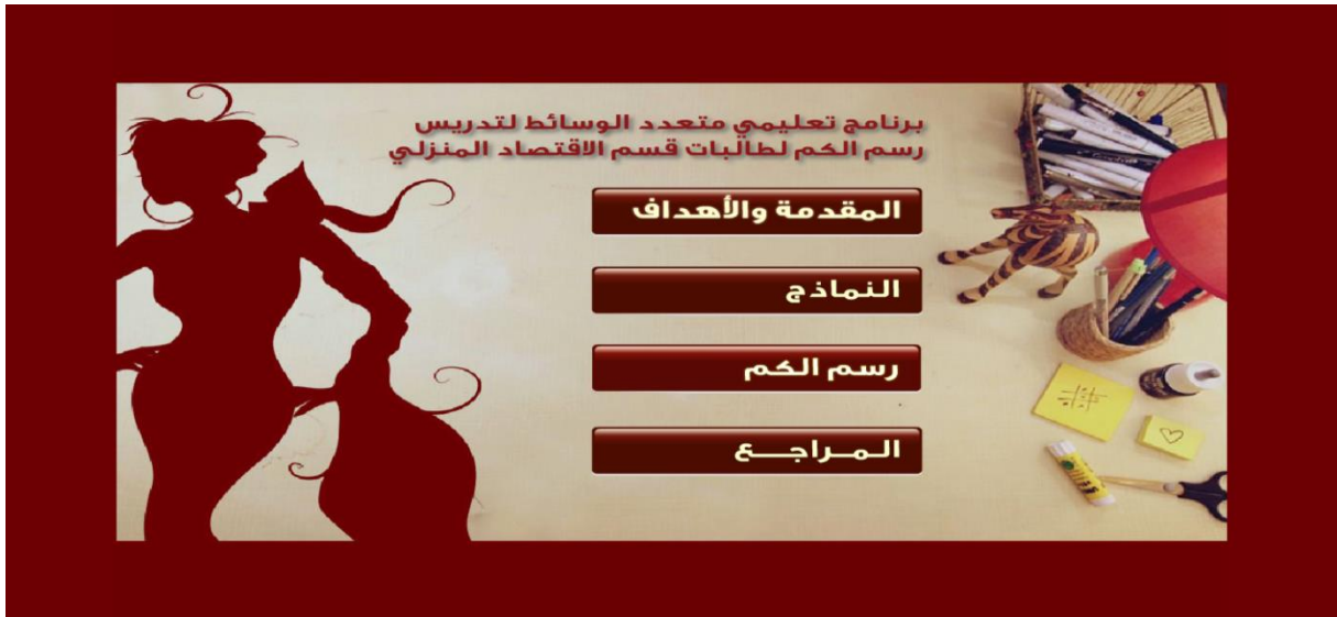
شكل رقم (٢) يوضح شاشة البرنامج الرئيسية

ثم يلي بعد ذلك الشاشة الرئيسية وهي تحتوي على الروابط الرئيسية في البرنامج شكل (٢)