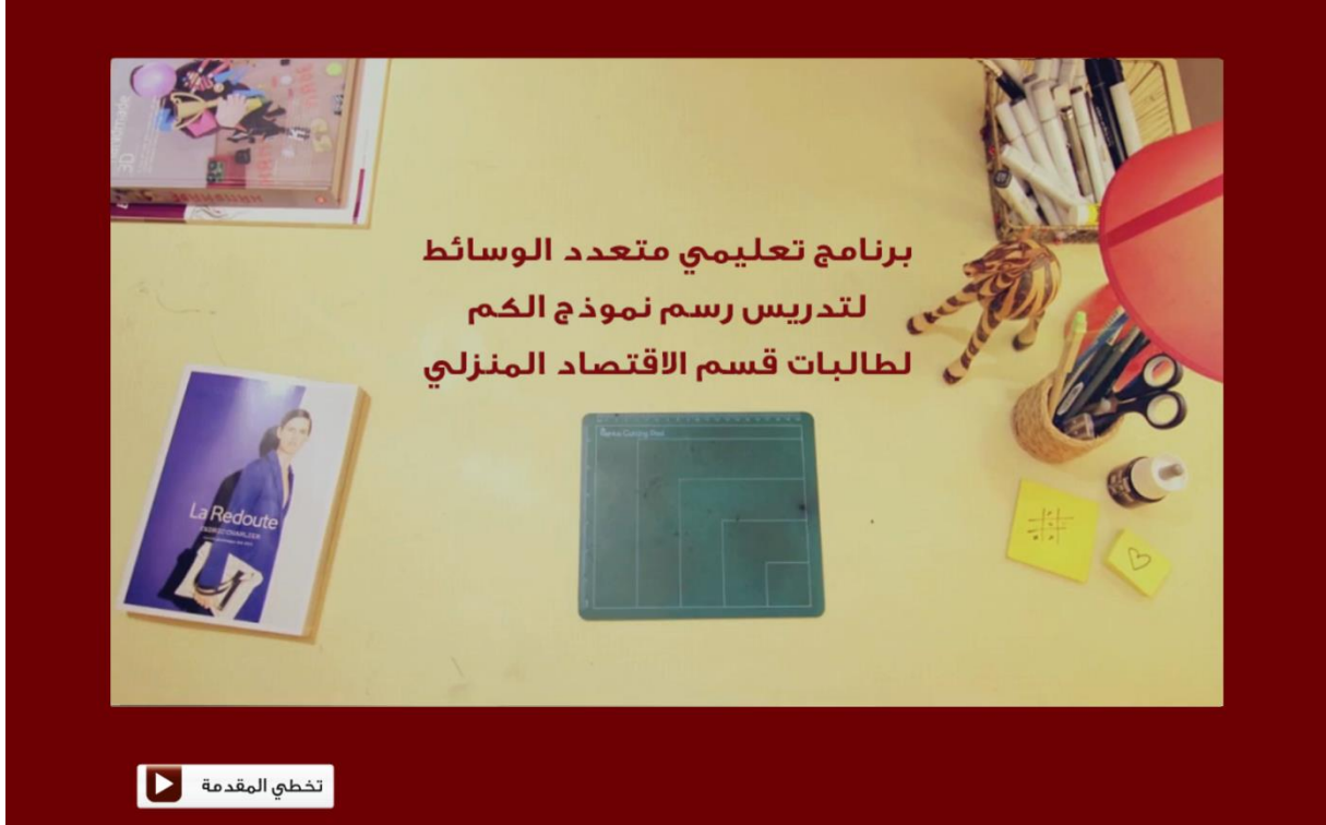
شكل رقم (١) يوضح شاشة المقدمة

تظهر مقدمة البرنامج لجذب انتباه المتعلم، وتظهر معها اسم البرنامج، وقد تم تصميمها باستخدام برنامج Final Cut، وتتضمن زر انهاء المقدمة للانتقال مباشرة الى الصفحة الرئيسية اذا اراد المتعلم تجاوز هذه المرحلة شكل (١)